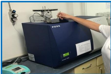
Analizador de proteínas