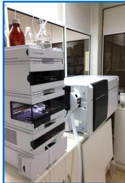
Cromatógrafo Líquido (LC: MS/MS Triple cuadrupolo)