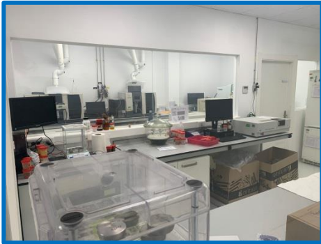
Área de Instrumental