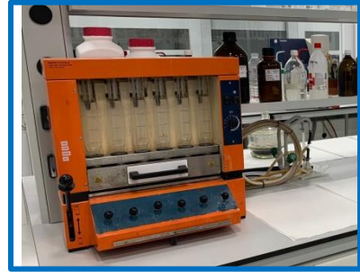
Equipo de Fibra Bruta