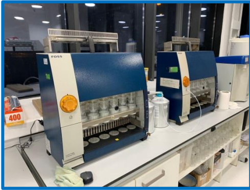
Analizador Automático de Grasa Total