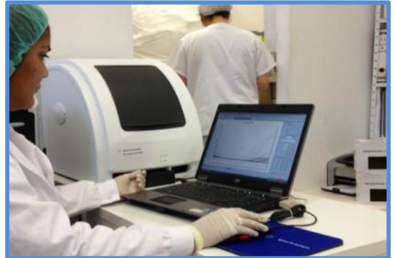
PCR - Real Time