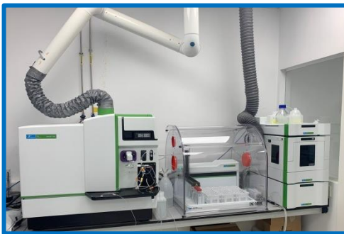
Equipo ICP MS + HPLC