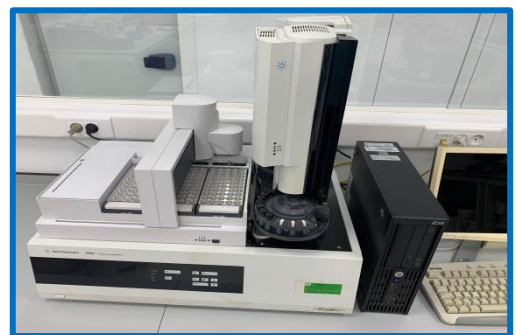
Sistema de preparación de muestras automático