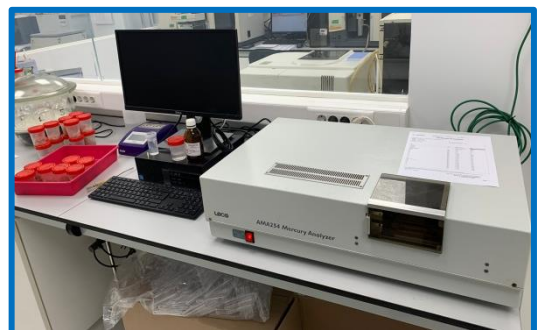
Analizador de Mercurio con amalgama de oro