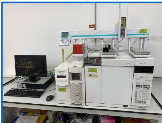
Cromatógrafo de Gases (Masas)